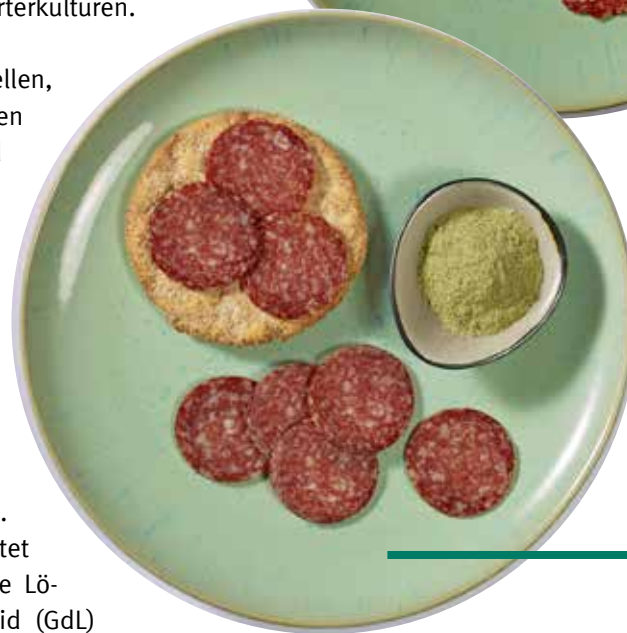
Neues aus der Kräuterküche: Salami mit SMAK® Gourmet Plus oG

Rezeptvorschläge zur Rohwurst (inklusive einer PRIMAL® SK-Übersicht)